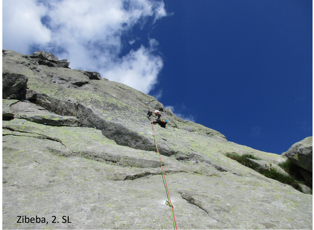
Zibeba, 2. SL