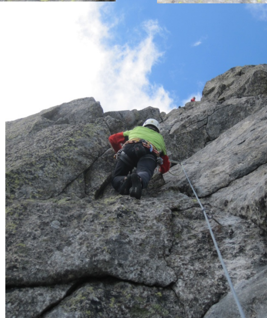
1. Beg. von «La rosa di ferro»