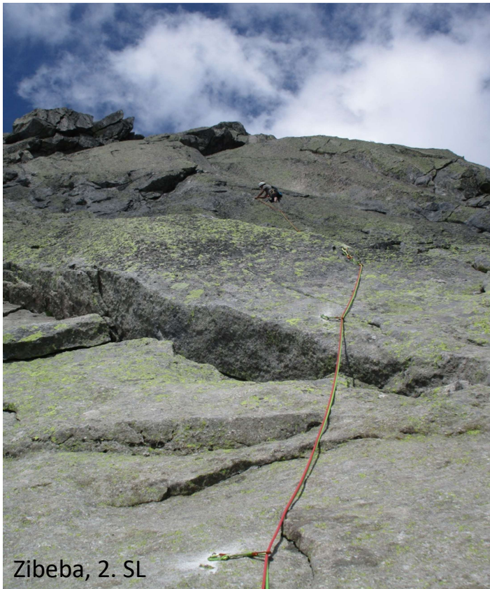
Zibeba, 2. SL