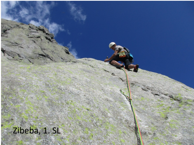
Zibeba, 1. SL