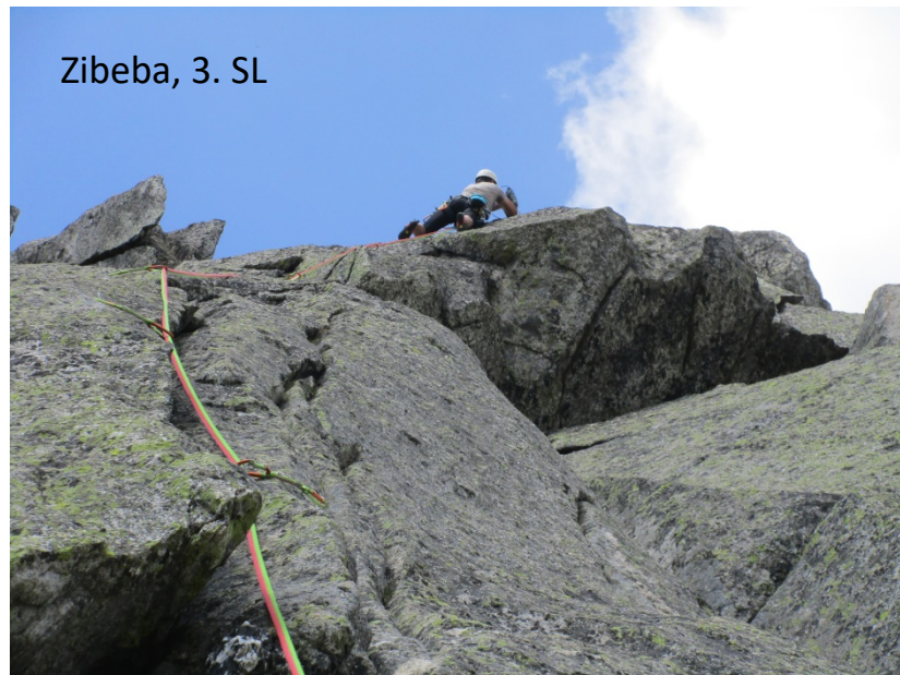
Zibeba, 3. SL